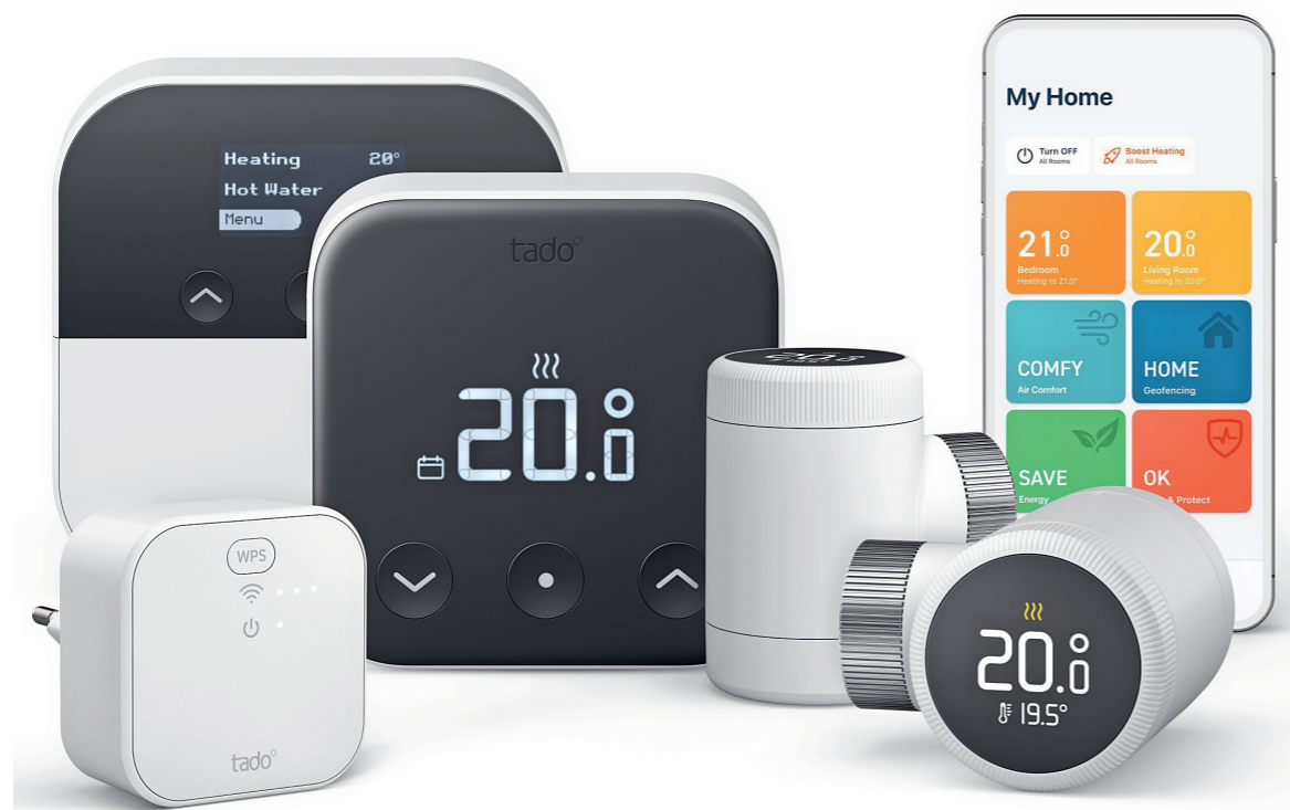
Smarte Thermostate für höhere Effizienz und Einsparungen für Heizungen und Wärmepumpen – die mit September neue erhältliche Produktlinie tado° X für Profis sorgt für noch intelligenteres Heizen und Kühlen: Wärmepumpen-Optimierer X, Bridge-X-Thread-Border-Router, Smartes Thermostat X, Smartes Heizkörper-Thermostat X und tado° App-Steuerung (v. l.).