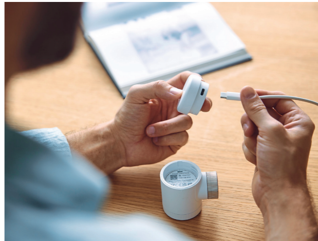
Über ein USB-C-Kabel lässt sich das neue Smarte Heizkörper-Thermostat X aufladen.

daten der nächsten 24 h zugegriffen. Zusätzlich ermöglicht Balance, die Effizienz, basierend auf der Außentemperatur, weiter zu optimieren und vorhandene Sparpotenziale noch weiter auszuschöpfen: Beispielsweise durch die automatische An- und Abwesenheitserkennung, um die Heizung herunterzufahren, wenn niemand zu Hause ist, mit energiesparenden Technologien wie der Fenster-Offen-Erkennung, mit Energy IQ für individuellen Energieverbrauch und -kosten sowie monatlichen Verbrauchsvergleichen oder mit Care & Protect zur Überwachung möglicher Fehlfunktionen des Heizsystems. Der Hersteller spricht von einer möglichen Ersparnis von rund 430 Euro pro Jahr,