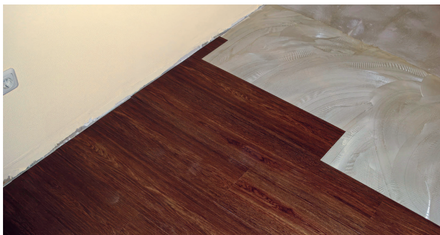
Die Dispersionskleberreste wurden mit einem feuchten Reinigungstuch abgewischt.

einem Schraubenzieher sind feine Kristalle erkennbar