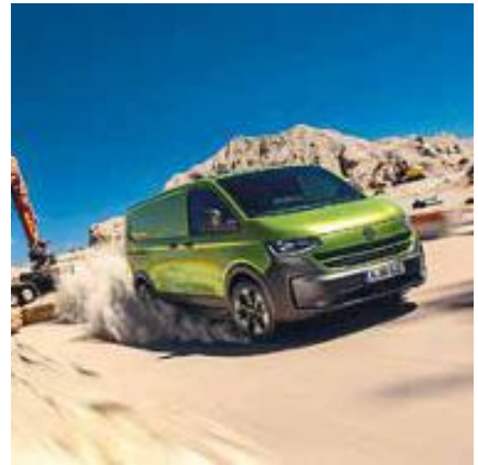
34 NEUHEIT FÜR DIE IAA TRANSPORTATION