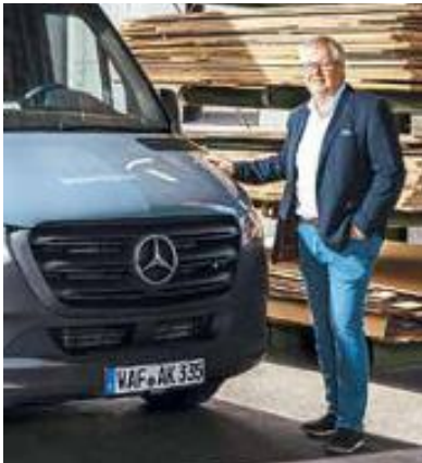
48 PREIS FÜR KFZ-SCHUTZ EXPLODIERT

Inhaber, die hart für ihre Kunden arbeiten, verdienen für ihre Gesundheit ein optimales Konzept: bester Schutz und ein Leben lang bezahlbar. Von Experten des Handwerks für Sie entwickelt.