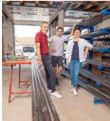
60 REGELUNGEN FÜR DEN TODESFALL