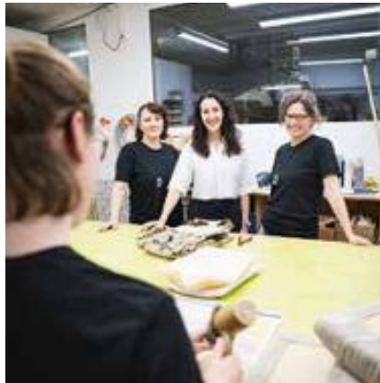
26 BERICHTSHEFT AUF DEM SMARTPHONE