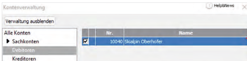
Kontenverwaltung mit fertig angelegtem Debitor

Klicken Sie im Kontenassistent „Speichern“. Die Neuerfassung des Kunden ist nun abgeschlossen.