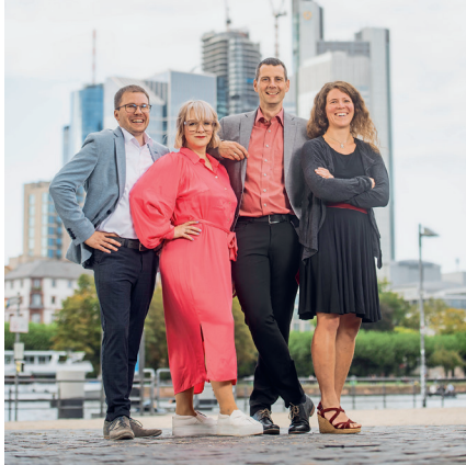
26 TOP GRÜNDER IM HANDWERK