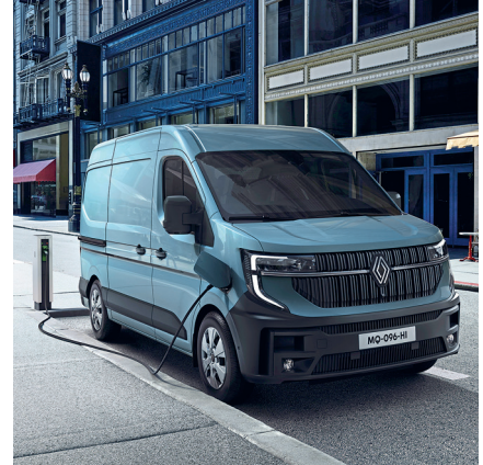
46 MARKTÜBERSICHT E-TRANSPORTER