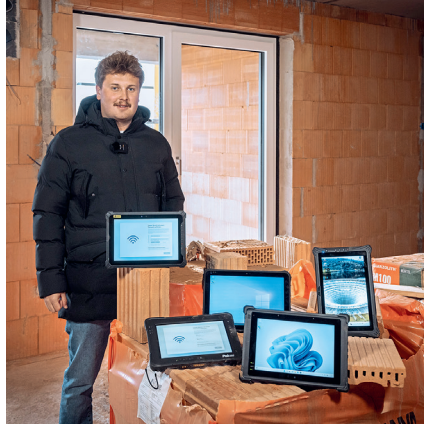
36 DER GROSSE TABLET-CHECK