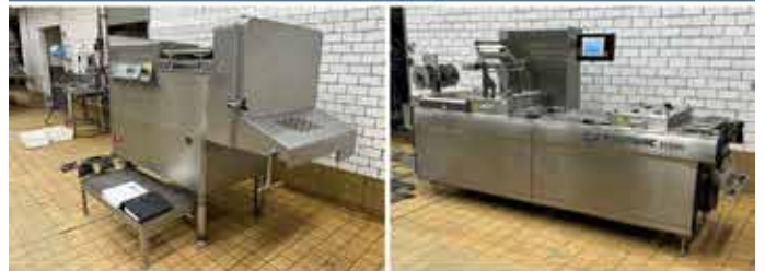
Online-Auktion von Schweineschlachtlinien, Zerlegungslinien, Fleischverarbeitungsmaschinen und Inventar in Ringsted (DK)