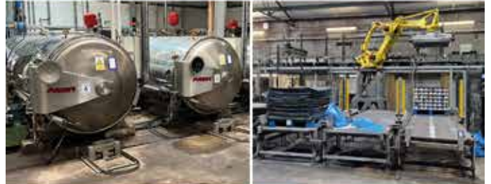
Online-Auktion von Maschinen und Inventar für die Produktion von Snacks und Convenience-Produkten in Deurne (NL)