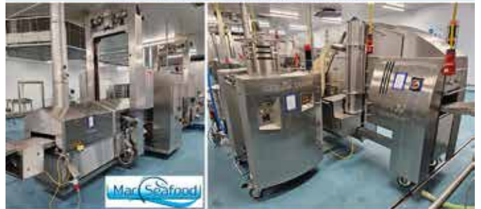
Online-Auktion von Maschinen für die Nahrungsmittelindustrie in Ystad (SE)