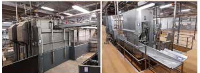
Registrier kostenlos Finden & bieten Gewinnen Bezahlen & abbilden